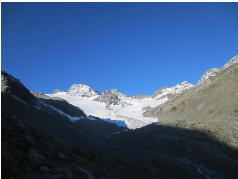
De Jamtalferner met de Obere Ochsencharte in het midden.

De dag erna was het schitterend weer en vermits we de weg reeds kenden tot aan de obere Ochsencharte was het eenvoudig deze te vinden. Door de sneeuw van de vorige dag was ons spoor op de gletsjer reeds volledig verdwenen en dus moest ik opnieuw alles sporen. Dit was nog steeds vermoeiend, maar het gaf me wel een goed gevoel te zien dat de andere touwgroepen hier handig gebruik van maakten. Toen we op de scharte kwamen zagen we reeds enkele touwgroepen op weg naar de Dreiländerspitze. Dit was logisch aangezien deze van de Wiesbadener Hütte kwamen en zodoende dus minder ver moesten gaan als ons. Ik spoorde verder over een steile sneeuwflank tot ik in het spoor kwam van de touwgroepen die van de Wiesbadener Hütte kwamen.