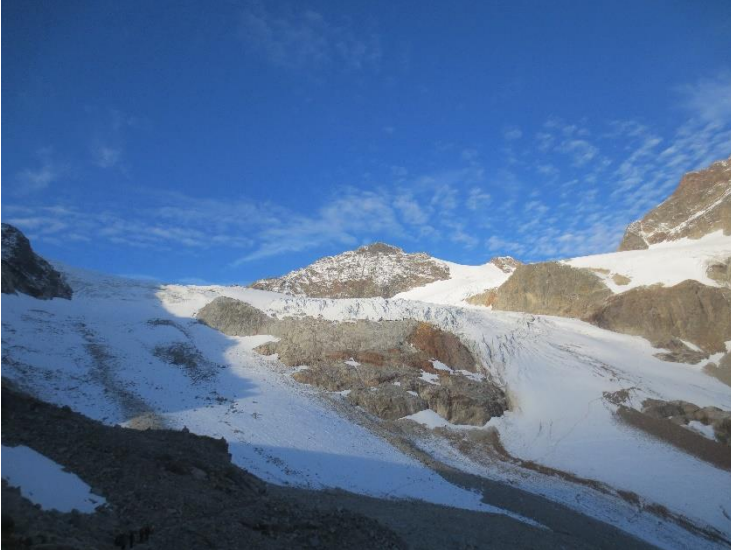
De Ochsentaler gletsjer met het spoor.

Nadat we de dag voordien de Dreiländerspitze beklommen hadden was het nu tijd voor een Oostenrijkse bergklassieker: de Piz Buin. Buiten het feit dat deze berg naamsbekendheid verwierf als zonnecrème is het tevens de hoogste berg uit het Silvrettagebied en zelfs uit gans Vorarlberg. Net zoals de overige touwgroepen vertrokken ook wij reeds in het donker vanuit de Wiesbadener Hütte. Toen we aan het begin van de Ochsentaler gletsjer kwamen was het reeds licht en konden we ons eenvoudig inbinden. Nu moesten we de 'autostrade' over de gletsjer volgen tot aan de Buinlücke (joch tussen grote en kleine Piz Buin). Alles was compleet gespoord en af en toe moesten er enkele gletsjerspleten omgaan worden.