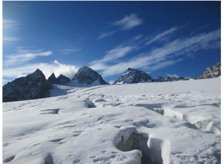
Zicht vanop de Ochsentaler Gletsjer op de Buinlücke en de Piz Buin.