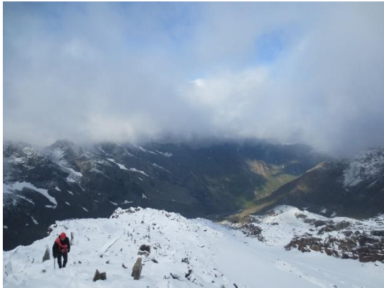
Even later zaten we in de wolken.

weersomstandigheden. Deze ervaring kon dus meegenomen worden voor toekomstige beklimmingen. Na het maken van de gebruikelijke topfoto's begaven we ons dan terug naar de Hochfeilerhütte.