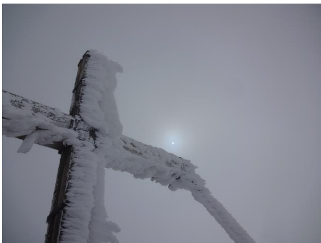
Het topkruis met een zon die tevergeefs probeert zich door de wolken te banen.