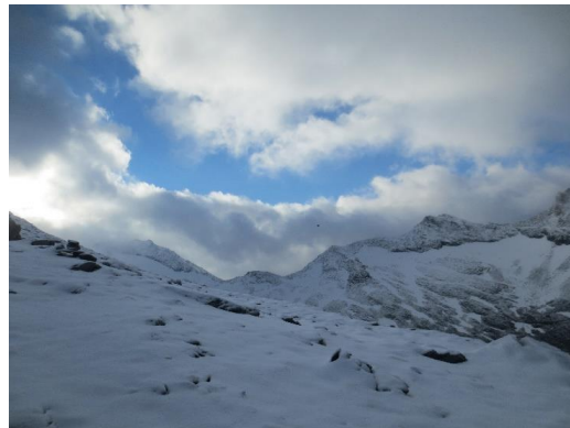
Zicht op Hochfeiler vanaf de hut tijdens een zeldzaam opklaarmoment.