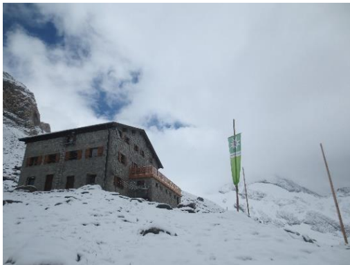
Hochfeiler Hütte 2710m

Na al een week in het Silvrettagebied vertoeft te hebben gingen we naar het Zillertal met als doel de Hochfeiler en de Schwarzenstein te beklimmen. We zetten onze wagen aan de Schlegeis Stausee wat we al kenden van er tijdens de Berliner Höhenweg enkele jaren geleden te passeren. Vandaar gingen we op weg naar het Pfitscher Jochhaus. Dit was slechts 2u stappen, maar over het uitzicht kan ik amper iets vertellen aangezien we constant in de wolken en de miezerregen gestapt hebben. We waren dan ook blij toen we in deze hut aankwamen. Dit is een moderne hut en dus niet supergezellig, maar ze beschikt wel over een heerlijk gratis warme douche wat welkom was in dit koude weer. Verder beschikt ze zelfs over een sauna, maar daar hebben we geen gebruik van gemaakt. De douche was al meer dan luxe genoeg voor ons. De dag erna ging over een mooie wandelweg naar de Hochfeiler Hütte. Toen we op een hoogte van 2500m kwamen zaten we in de sneeuw want het had vannacht flink gesneeuwd. De laatste 200 meter naar de hut moesten we dan nog door de sneeuw stappen. Deze hut is wel gezellig en biedt mooie uitzichten. We hebben er dan de rest van de dag gependend want voor de Hochfeiler vonden we het nog te slecht weer.